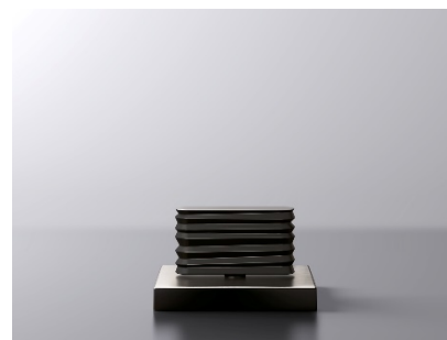
CL1_Dark Platinum matt_05.jpg

Bei den Griffen stehen neben der glatten auch zwei strukturierten Varianten zur Auswahl, die eine unverwechselbare Optik und Haptik vermitteln