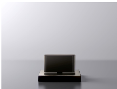
CL1_Dark Platinum matt_03.jpg

Die Variante der CL.1 in Dark Platinum matt verleiht der Form einen anderen, besonders skulpturalen Charakter