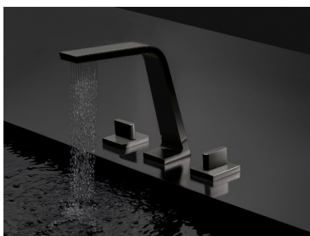
CL1_Dark Platinum matt_02.jpg

Die Variante der CL.1 in Dark Platinum matt verleiht der Form einen anderen, besonders skulpturalen Charakter