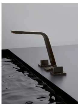
CL1_Dark Platinum matt_01.jpg

Download-Link: http://media.dornbrachtgroup.com/WorldPort/public/3MgzkT9k